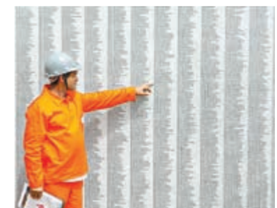
Operário mostra lista de trabalhadores que atuaram nas obras do Rodoanel Sul

Iniciada em maio de 2007, o empreendimento durou 35 meses, o que equivale a 1,75 km por mês, um trabalho de ponta de engenharia. Na área ambiental, foi realizado 13 audiências públicas e hoje tem 26 programas para a preservação de Fauna e Flora. Segundo o governador Serra, a obra preservou o meio ambiente. "Para cada árvore derrubada vamos ter cinco plantadas e vamos ter um grande parque aqui que será uma reserva ecológica".