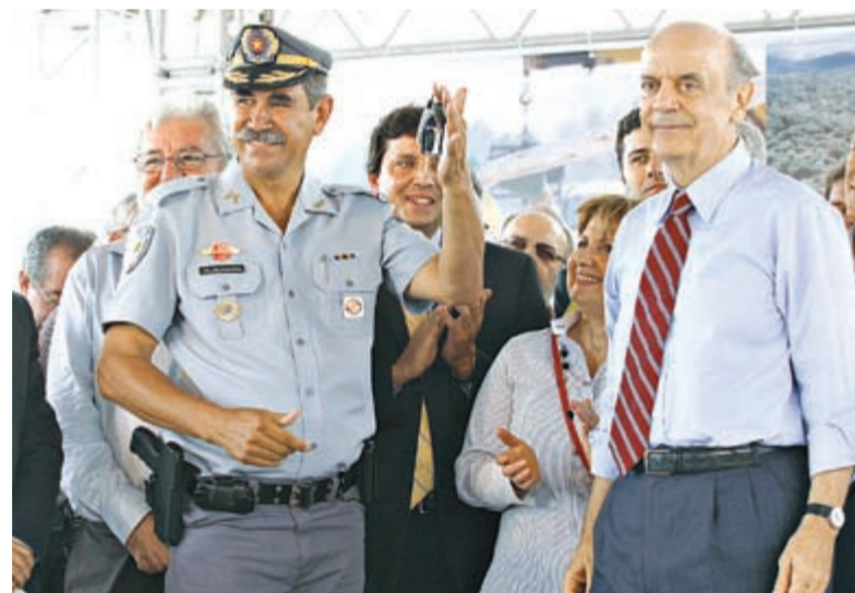
Governador Serra entrega chaves de viaturas para a Polícia Rodoviária

"O Rodoanel é um empreendimento do Governo de São Paulo de abrangência nacional. Equaciona o sistema viário da Região Metropolitana de São Paulo e racionaliza o fluxo de cargas que cruzam o estado, seguem para o Porto de Santos e para os países do Mercosul, contribuindo diretamente para a otimização da economia nacional. Desta forma, ajuda a gerar benefícios à população e a avançar o desenvolvimento de São Paulo e municípios vizinhos", comentou o deputado estadual Orlando Morando.