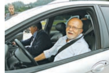
Alberto Goldman liberou o tráfego no trecho Sul do Rodoanel e elogiou a qualidade da obra

to, o governo promove audiências públicas. Portanto, até o final do ano ele deverá estar licitado. Espero que possa começar ainda este ano. Quanto ao trecho Norte, o processo deve ficar pronto durante este ano, mas é só o próximo governo que vai poder viabilizá-lo", afirmou Goldman.