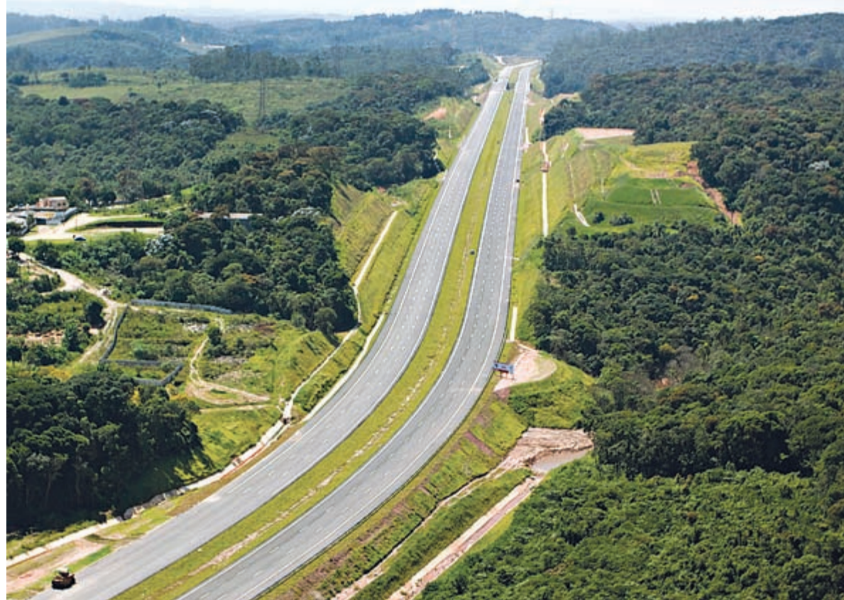
Cerca de 16,5 mil caminhões e 55,5 mil veículos de passeio deverão passar, por dia, nos 61,4 quilômetros do Trecho Sul

A maior obra viária da América do Sul interliga cinco rodovias do interior ao litoral paulista (pelo Sistema Anchieta-Imigrantes) sem passar pela capital.