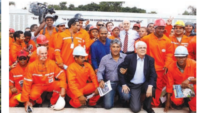
"Só esta obra já deu na sua construção cerca de 40 mil empregos diretos e indiretos", ressaltou o governador José Serra

Complexa, a obra teve grandes desafios de engenharia. Foram 134 viadutos, pontes e acessos, o que equivale a cerca de 20 km de extensão ou um terço da obra. Vale destacar que as duas pontes sobre a represa Billings, uma de 685 metros e outra de 1.755 metros, representam 8% da obra. Diferentemente de outros projetos, a maior ponte do Trecho Sul tem vãos de 100 metros para minimizar o impacto no fundo da represa. Essa preocupação com soluções de menor impacto para região foi uma constante no Rodoanel Sul.